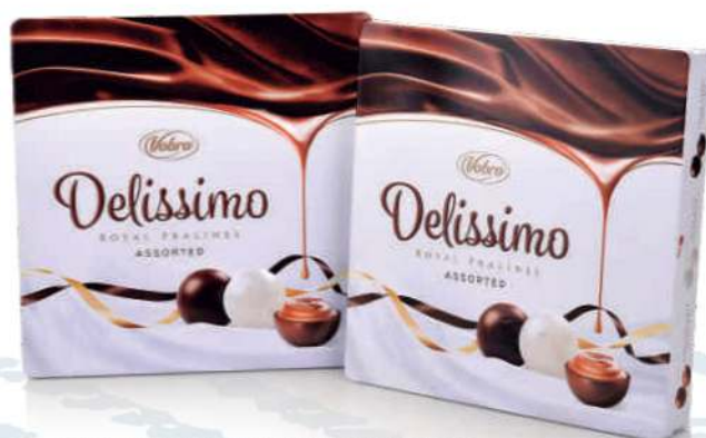
LATA DE BOMBONES DELÍSSIMO PRALINÉ $ 157 GR