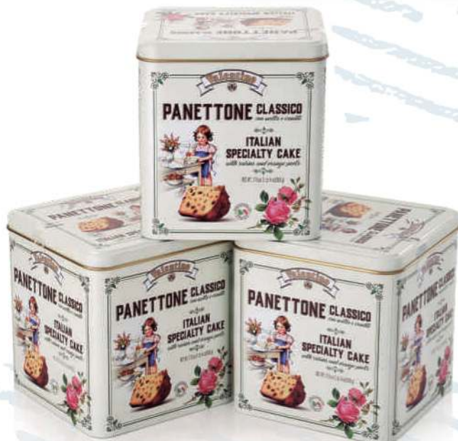
PANETTONE ITALIANO VALENTINO EN LATA 500

Haga sus pedidos con anticipación. Siempre respetaremos la fecha de entrega que usted nos indique.