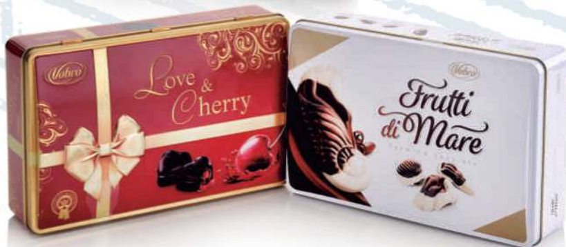
LATA DE BOMBONES VOBRO PRALINÉ O CHERRY 350/290 GR