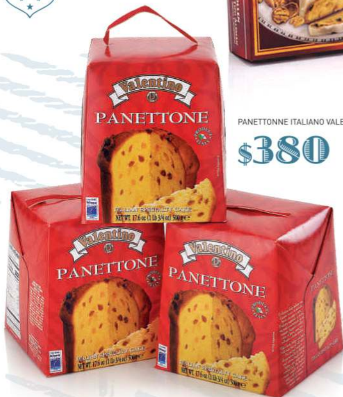
PANETTONE ITALIANO VALENTINO CAJA 500 GR