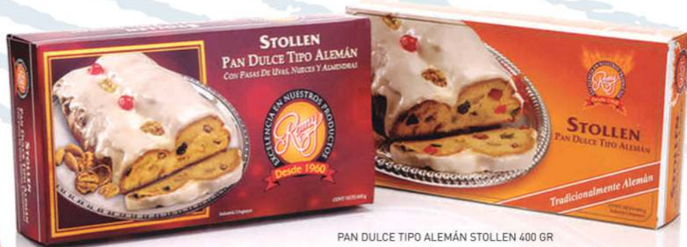
PAN DULCE TIPO ALEMÁN STOLLEN 400 GR